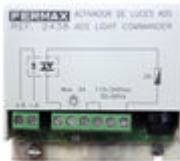
F02438 ACTIVEUR SONNETTE OU ECLAIRAGE VDS