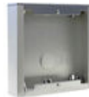
F07061 BOÎTIER EN SAILLIE CITY S1