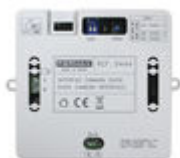
F09444 INTERFACE CAMÉRA DUOX PLUS