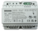
F04826 ALIMENTATION+FILTRE DIN6 24VDC-1.5A