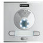
F40008 PLATINE CITY S1 CP201 DUOX PLUS