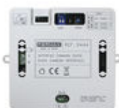
F09444 INTERFACE CAMÉRA DUOX PLUS