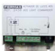
F02438 ACTIVATEUR SONNETTE OU ECLAIRAGE VDS