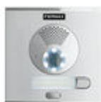
F40708 PLATINE CITY S1 CP101 DUOX PLUS