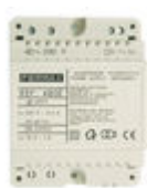
F04802 ALIMENTATION DIN4 230VAC/12VAC-1A