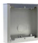
F07061 BOÎTIER EN SAILLIE CITY S1