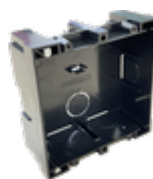
F08948 BOÎTIER ENCASTRABLE KIT S/1