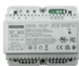
F04826 ALIMENTATION+FILTRE DIN6 24VDC-1.5A