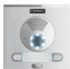
F40008 PLATINE CITY S1 CP201 DUOX PLUS