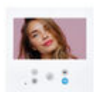
F09469 MONITEUR VEO-XL WIFI 7" DUOX PLUS