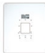
F03389 MARCO UNIVERSAL LARGE