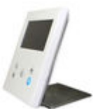
F09420 SOPORTE SOBREMESA MONITOR VEO-XS/VEO-XL