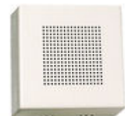
F02040 PROLONGADOR LLAMADA TELEFONO