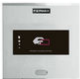
F06992 LECTEUR PROXIMITÉ CITY