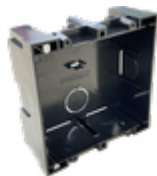
F08948 BOÎTIER ENCASTRABLE KIT S/1