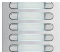
F04844 PLATINE AUDIO KIT CITY 4+N 24/BP